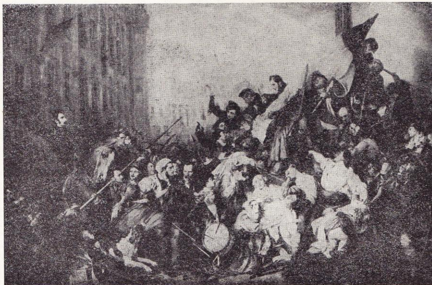
Gustave Wappers. — Episode des Journées de Septembre.

monde entier. Ici déjà, nous attendons qu'on nous arrête: flamande? Sans doute les peintres flamands étaient et furent toujours la majorité. C'est de centres flamands comme Bruges, Gand, puis Anvers, qu'elle rayonna plus particulièrement. Il serait puéril, même sot et surtout fort impolitique, d'essayer de substituer à cette appellation d'Ecole flamande dont on a usé partout à travers les siècles, le terme: Ecole belge. Et cependant celui-ci serait plus pertinent. D'abord la généralité